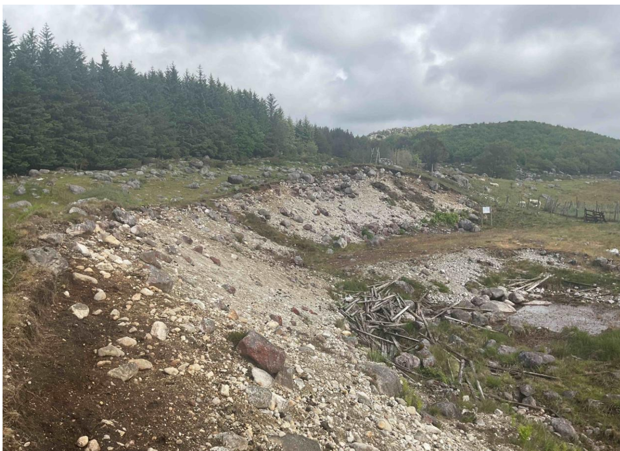
Figur 4.3. Løs sterkt endret fastmark med dekke av sand eller grus i St. olavsormen naturminne.