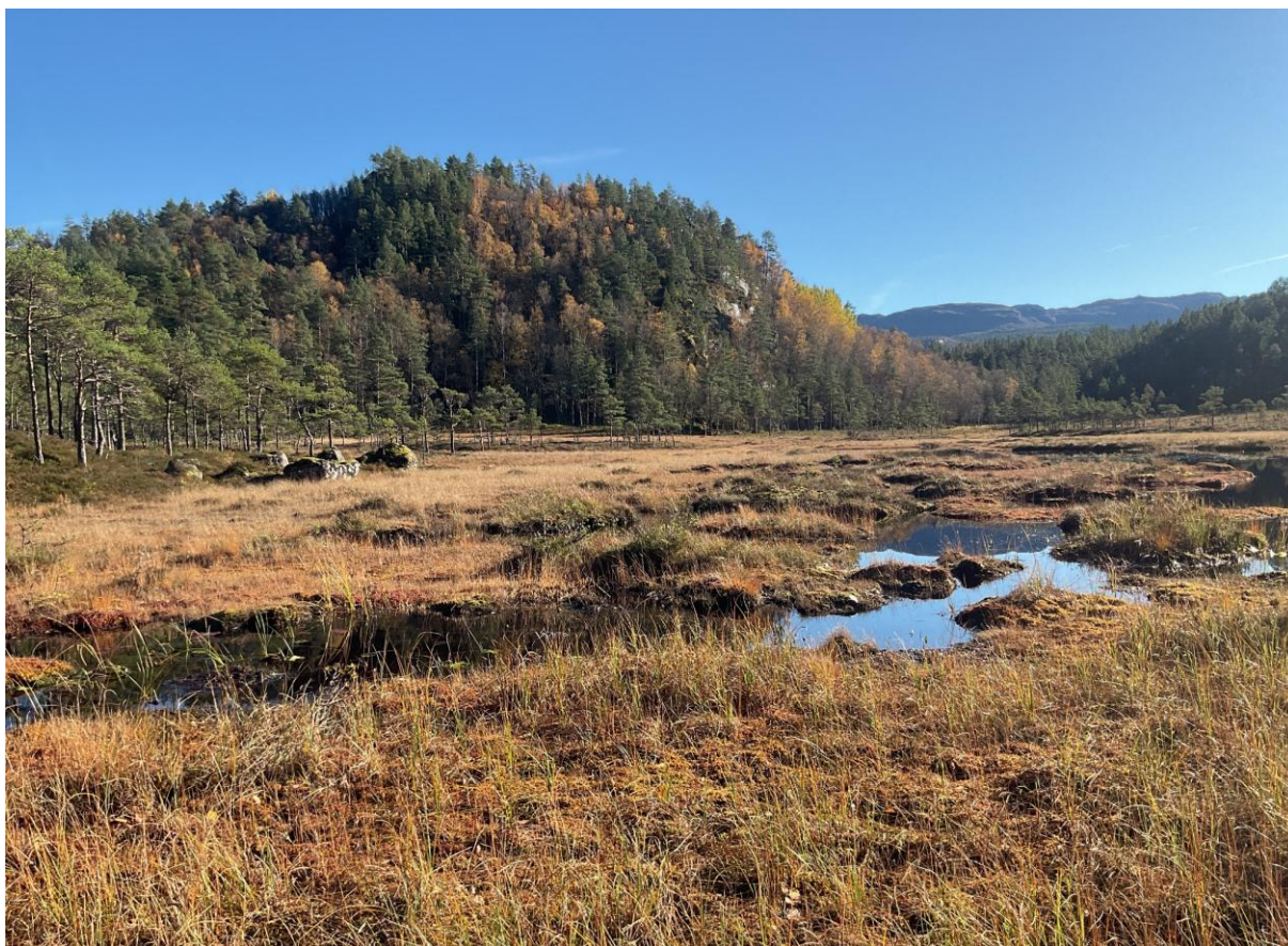
Figur 3.4. Åpen jordvannsmyr og tjern til høyre i Nordraheia.