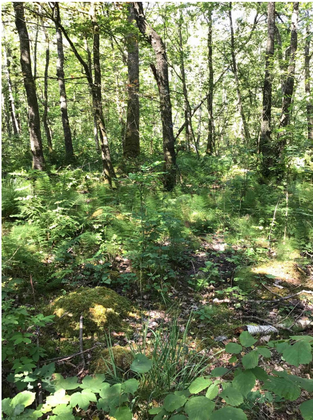
Figur 5.1. Lågurtskog i Gausel naturreservat.