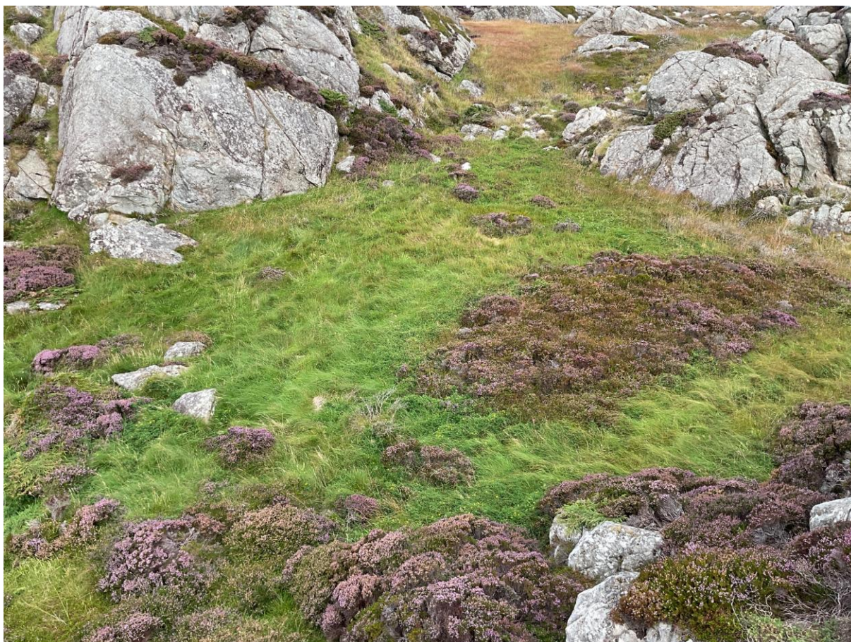
Figur 6.4. Kystlynghei med nakent berg og åpen jordvannsmyr i bakgrunnen på Indrevær.