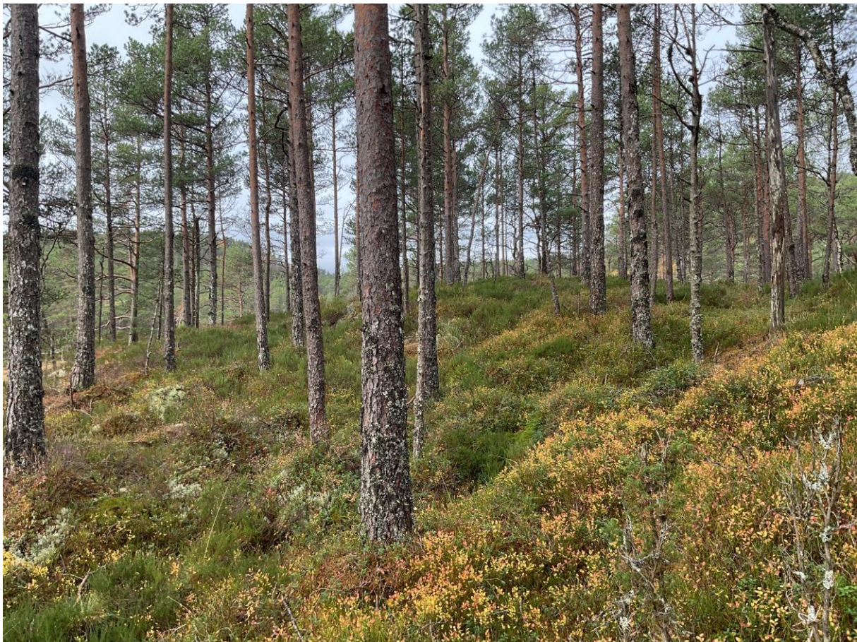
Figur 3.1. Bærlyngskog søt i kartleggingsområdet i Nordraheia.