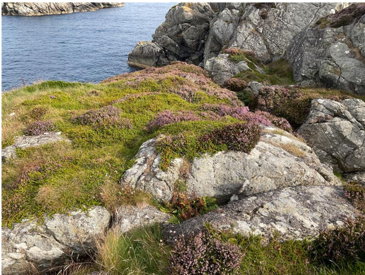
Figur 6.3. Kystlynghei, grunnlendt lyngmark og nakent berg i mosaikk på Indrevær.