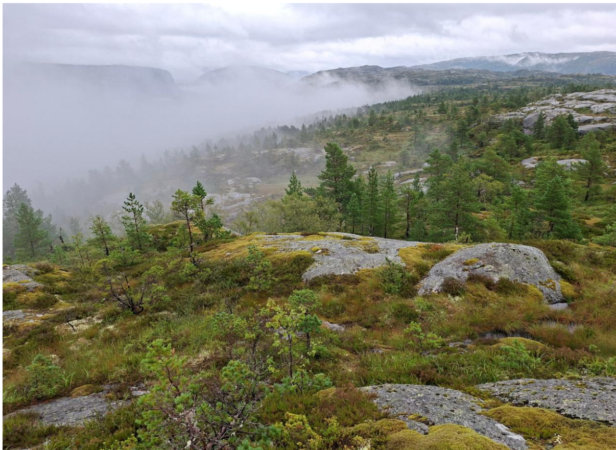
Figur 3.2. Nakent berg og grunnlendt lyngmark i Nordraheia.