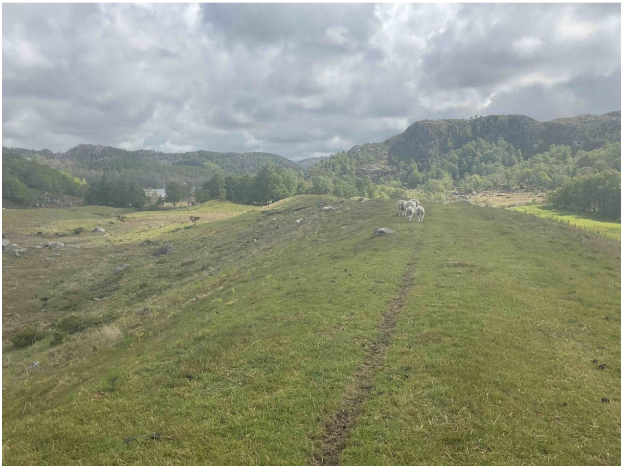
Figur 4.1. Oppdyrket varig eng i St. Olavsormen naturminne.