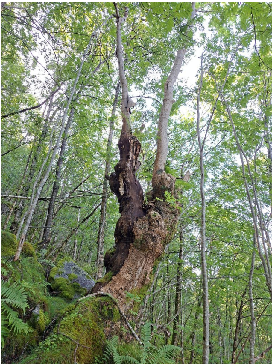
Figur 3.6. Ask (EN) i lisa mot Jøsenfjorden, nord i Nordraheia.