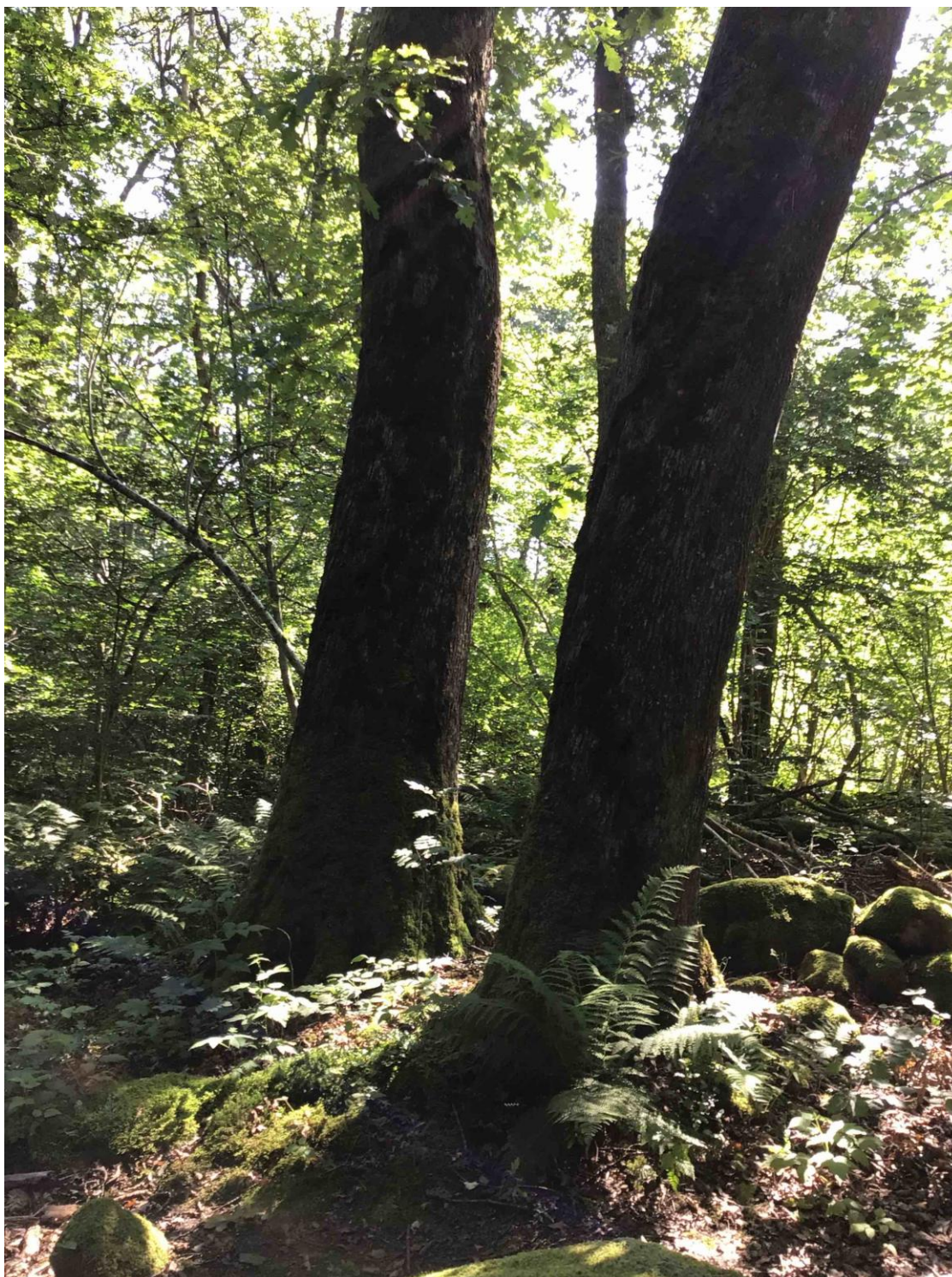
Figur 5.2. Hule eiker nord i Gausel naturreservat.