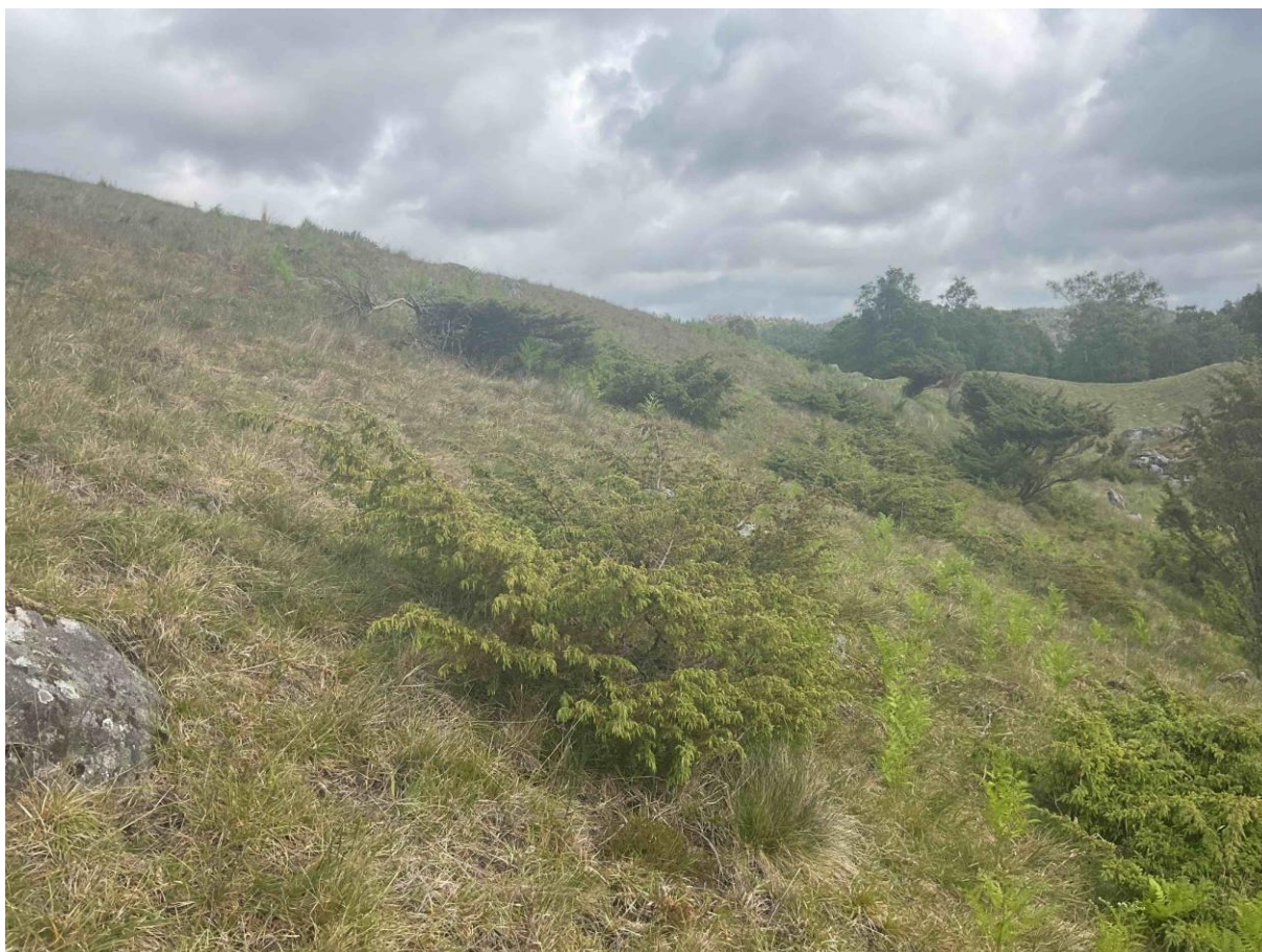
Figur 4.2. Intermediær semi-naturlig eng med svakt preg av gjødsling i St. Olavsormen naturminne.