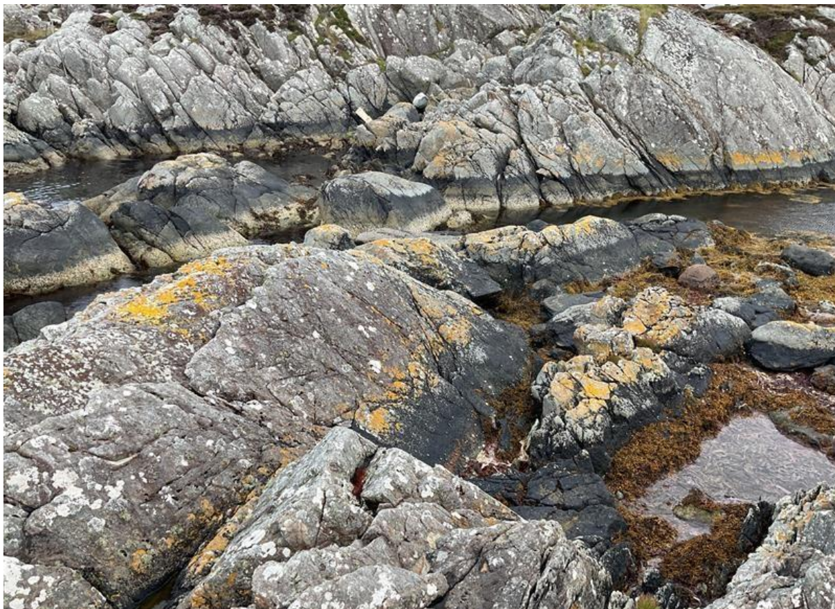
Figur 6.2. Nakent berg og strandberg på Indrevær.