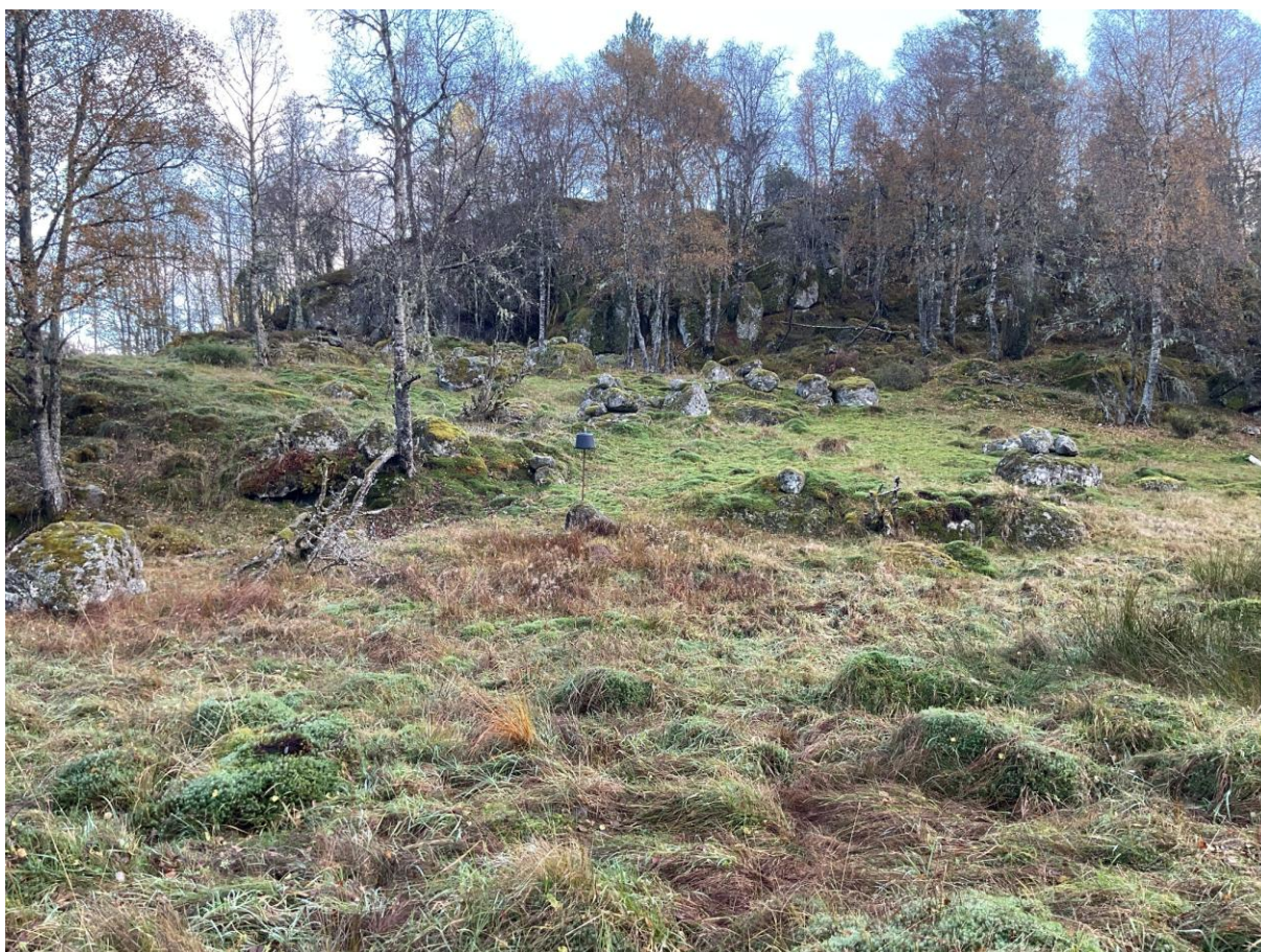
Figur 3.5. Semi-naturlig eng nord i kartleggingsområdet i Nordraheia.