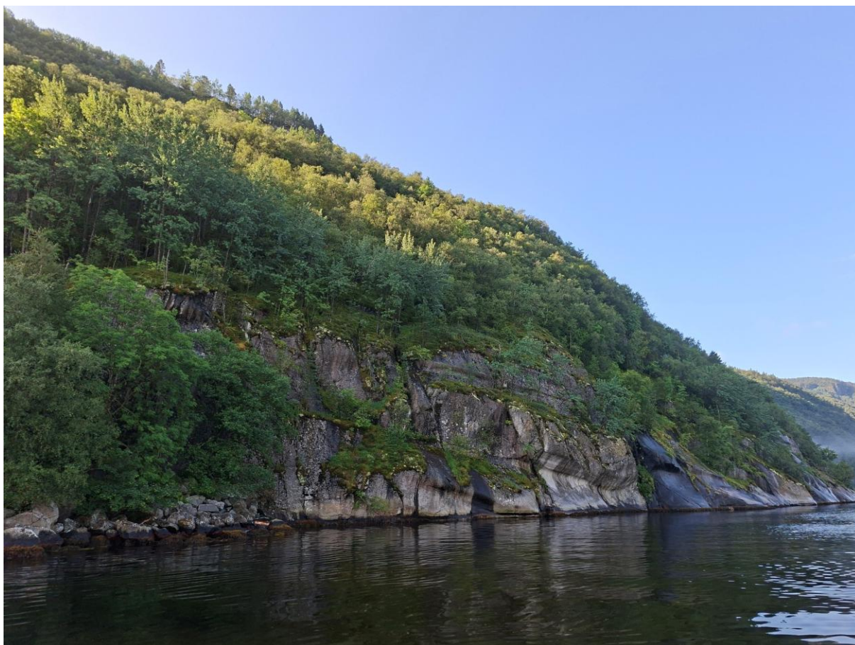
Figur 3.7. Bærlyngskog og blåbærskog i bratt liseide mot Jøsenfjorden, nord i Nordraheia.