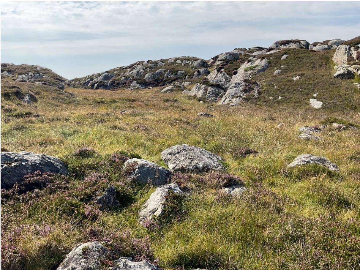
Figur 6.1. Kystlynghei og åpen jordvannsmyr på Indrevær.