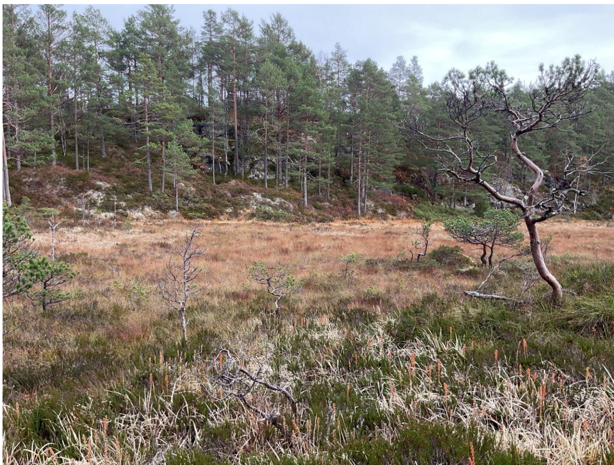
Figur 3.3. Åpen jordvannsmyr og myrkant i Nordraheia.